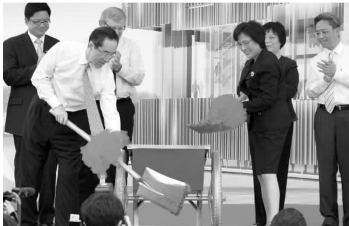
7月2日,香港特别行政区政府政务司司长唐英年(前左一)和上海世博会执委会专职副主任钟燕群为地基盖上最后一铲混凝土。当日,上海世博会香港馆完成地基工程。香港馆的主题为“无限城市”。